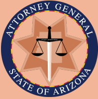
Arizona Attorney General Kris Mayes